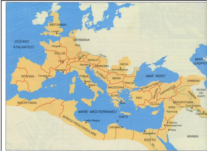
L'Impero romano nel periodo della sua massima espansione 1