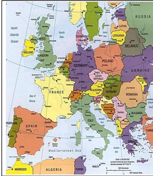
I confini dell'attuale Germania