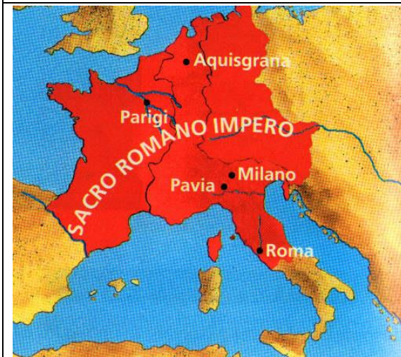
Il Sacro Romano Impero ai tempi di Carlo Magno