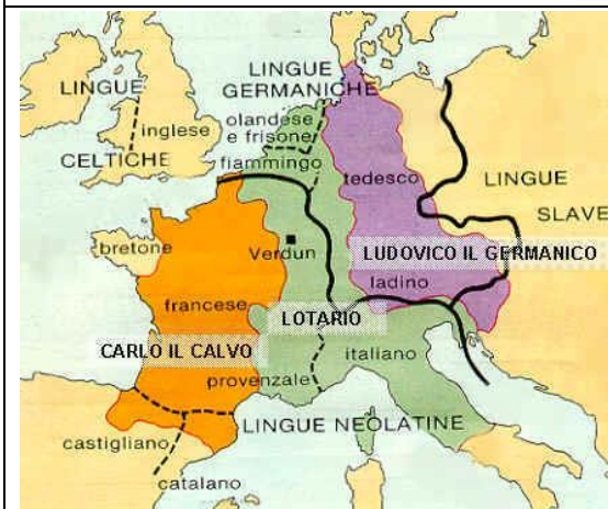
Il Sacro Romano Impero dopo Carlo Magno